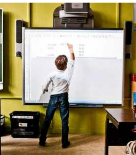
Een "slim" schoolbord.

Minder menselijk contact: veel kantoren zijn gesloten, wat vooral ouderen en minder digitaalvaardige mensen treft. Jobverlies: digitalisering heeft geleid tot ontslagen en herstructureringen in de sector. Cyberbissico's: meer online betekent ook meer kans op fraude, phishing en datalekken. Discriminatie: niet iedereen heeft toegang tot digitale middelen of is ermee vertrouwd, wat uitsluiting kan veroorzaken. Grote banken digitaliseren sneller dan kleine, wat ook de concurrentiepositie beïnvloedt. Toch blijft het belangrijk dat banken persoonlijke ondersteuning bieden bij levensmijlpalen, zoals leningen of hypotheek.