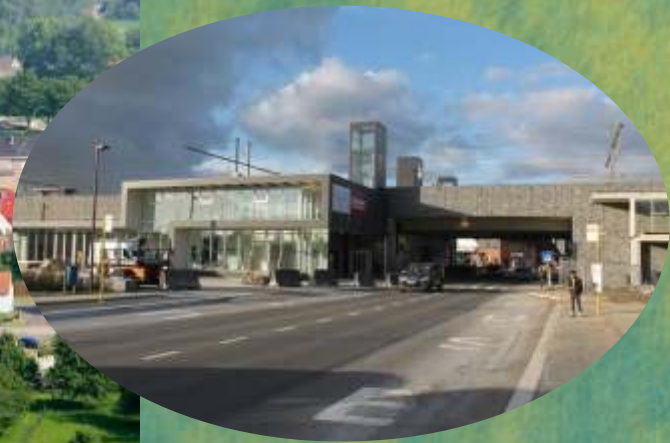
De Vlaamse Randregio tussen Affligem en Brussel