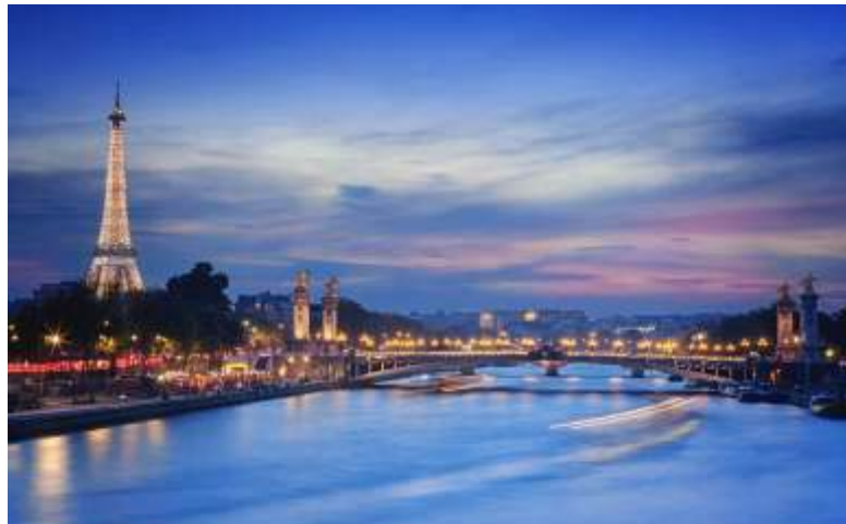
Parijs klaar voor de Olympische Spelen?